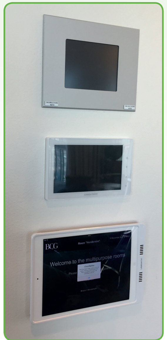
Standalone systemer på kontor